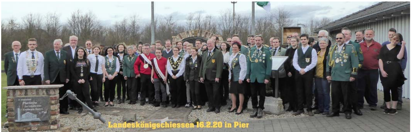
Landeskönigsschießen 16.2.20 in Pier

Am Sonntag , dem 16.2.20 , fand auf dem Schießstand der Sportschützen St. Sebastianus Pier 2000 e.V. das diesjährige Landeskönigs- / Landesjugendkönigsschießen statt. Es nahmen alle Bezirks- und Kreiskönige/innen der Vereine teil, die dem RSB angeschlossen sind. Geschossen wurden mit dem Luftgewehr 20 Schuss Auflage. Den Titel eines Landeskönigs/in errang der Schütze/in mit dem kleinsten Teiler. Neben der neuen Würde ging es auch um die Qualifikation zum Bundeskönigsschießen, das im Sommer in Hamburg durchgeführt wird.