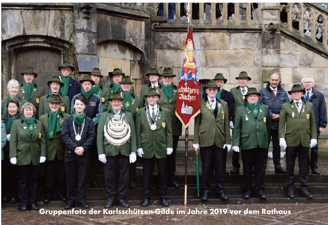
Gruppenfoto der Karlsschützen-Gilde im Jahre 2019 vor dem Rathaus